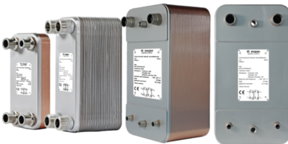
Рис.1 - Внешний вид теплообменников пластинчатых типа ВРНЕ

Теплообменники пластинчатые типа ВРНЕ предназначены для передачи тепловой энергии от одного теплоносителя к другому. Теплообменники пластинчатые типа ВРНЕ могут применяться в холодильных установках (компрессорных, абсорбционных), а также в тепловых насосах. В качестве рабочих сред могут использоваться негорючие хладагенты (фторуглероды, хлорфторуглероды, аммиак, CO 2 ), технические и холодильные масла, вода для технических нужд и систем ГВС, спиртосодержащие растворы.